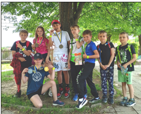
Reprezentační atletické družstvo.