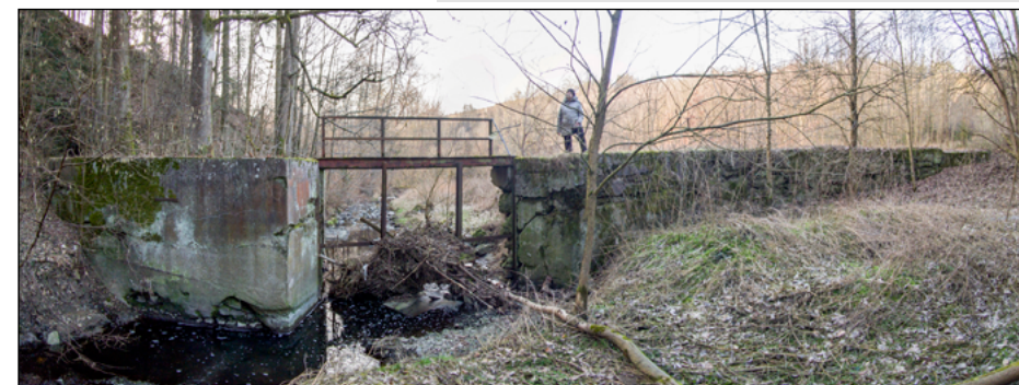
Zbytky hráze rybníka Floriánek.