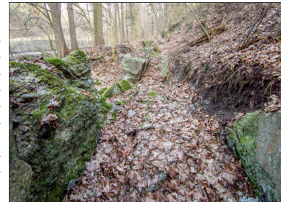
Zbytky vodního náhonu.