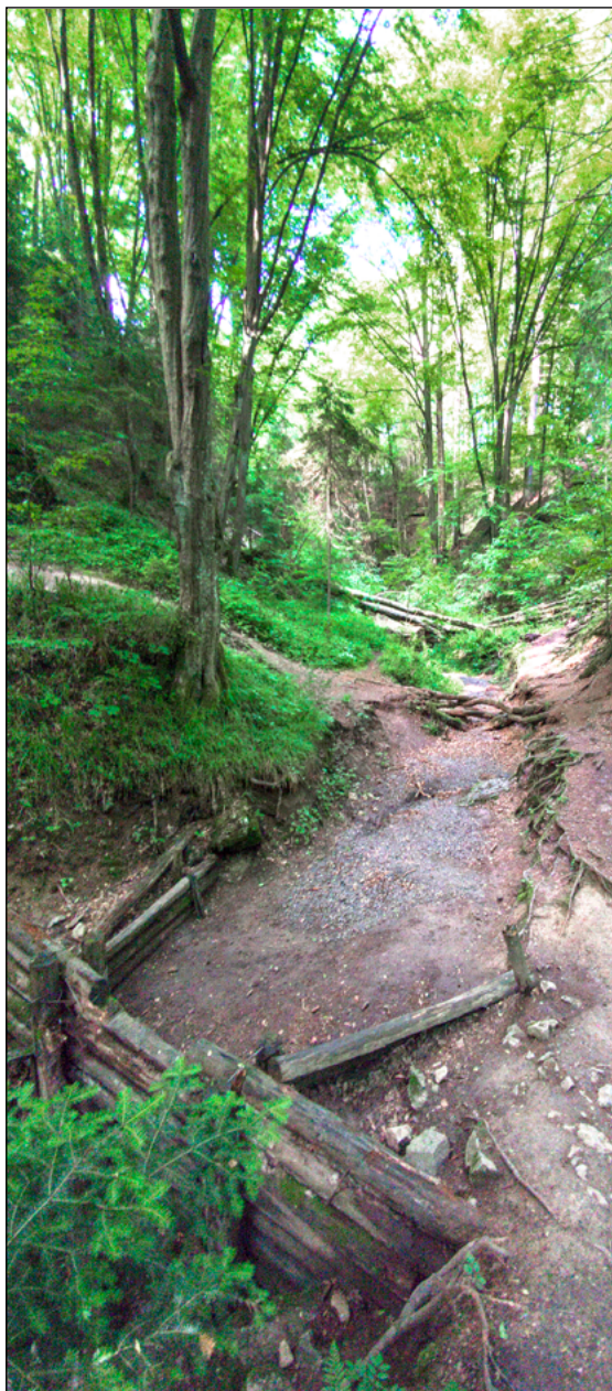
Žlíbek „Ve struskách“ se zchátralou hrázkou.

splavované strusky zachytí. Nejlepším řešením by zřejmě bylo haldy strusky odtěžit, což se však jeví jako technicky moc náročné, ne-li nemožné, vzhledem k jejímu velkému množství a špatně přístupnému terénu. Naštěstí je dnes již na obrovských haldách vzrostlý les a do propadání je tak splavována „jen“ struska ze dna žlíbku.