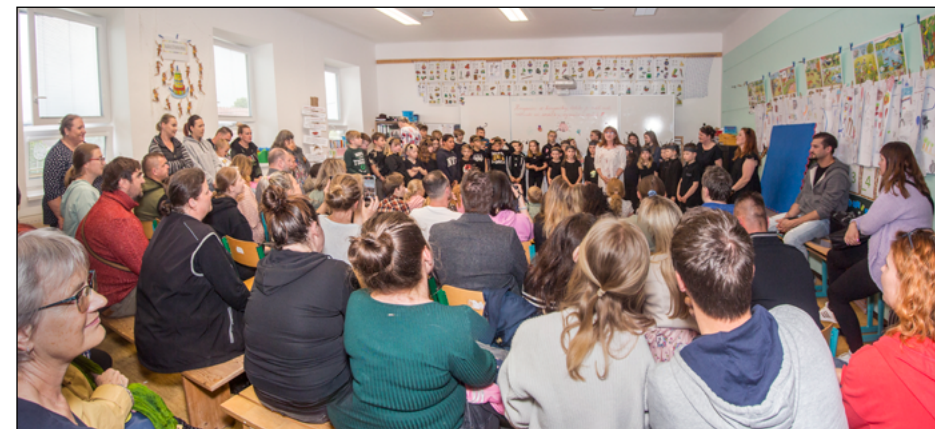
Z vernisáže výstavy Hmyz očima dětí.