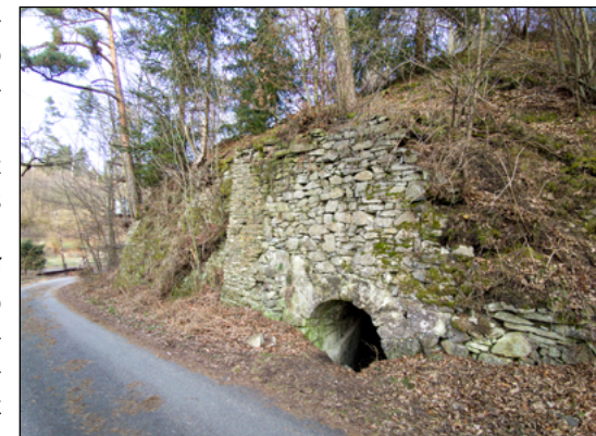
Opěrná zeď s vyústěním vodního náhonu.