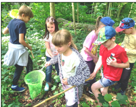
Akční program v Domě přírody.

Výukové zážitkové programy naši prvňáci a druháci absolvovali v Domě přírody na Skalním mlýně, a také se vypravili na návštěvu do naší spádové Mateřské školy v Bukovince. Velmi očekávanou školní akcí byl zážitkový pobyt na Baldovci, kde jsme v krásném prostředí prožili tři dny, plné ná-