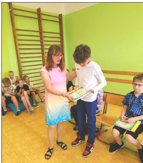
Knihy pro pátáky.