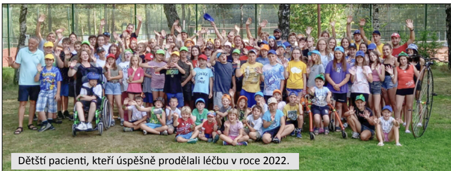
Dětské pacienti, kteří úspěšně prodělali léčbu v roce 2022.

Nikdy jsem se nesmířil s tím, že ztrácíme pacienta, že už mu nejsme schopni nic nabídnout, že ho neumíme vyléčit. Chtěl bych se ještě ve svém životě dožít toho, abychom mohli poskytnout pomoc co největšímu počtu dětí z těch, které dnes ztrácíme. Abychom nemuseli v průběhu léčby brát naději jim a jejich rodičům.